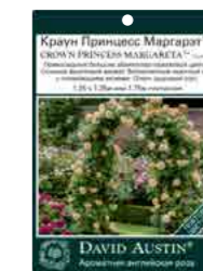
Подвесные этикетки (14 x 10см)