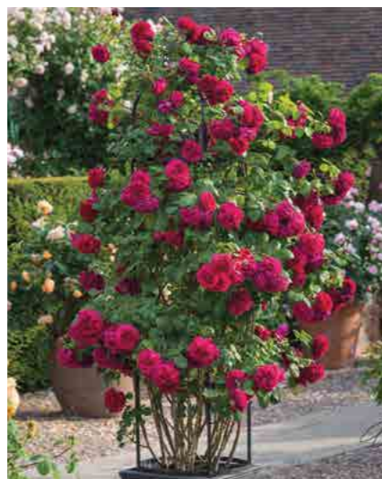
ТЭСС ОВ ЗЭ ДЁБЕРВИЛЗ TESS OF THE D'URBERVILLES® (Ausmove) 2,5М