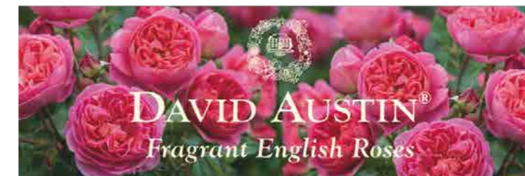
Пластиковая погодостойкая рекламная вывеска (51 x 180см) с глазками для подвешивания