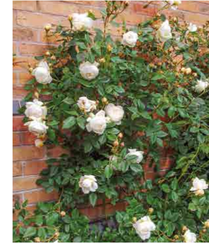
КЛЭР ОСТИН CLAIRE AUSTIN® (Ausprior) 3,75М