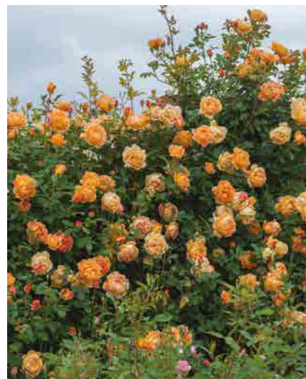
ЛЕДИ ОВ ШАЛОТ LADY OF SHALOTT® (Ausnyson) 2,5М