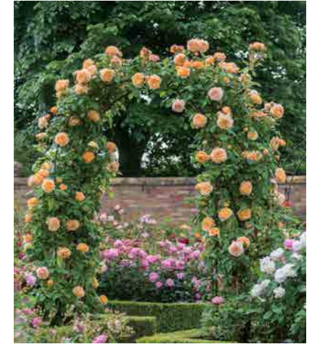
КРАУН ПРИНЦЕСС МАРГАРЭТА CROWN PRINCESS MARGARETA® (Auswinter) 3,75М