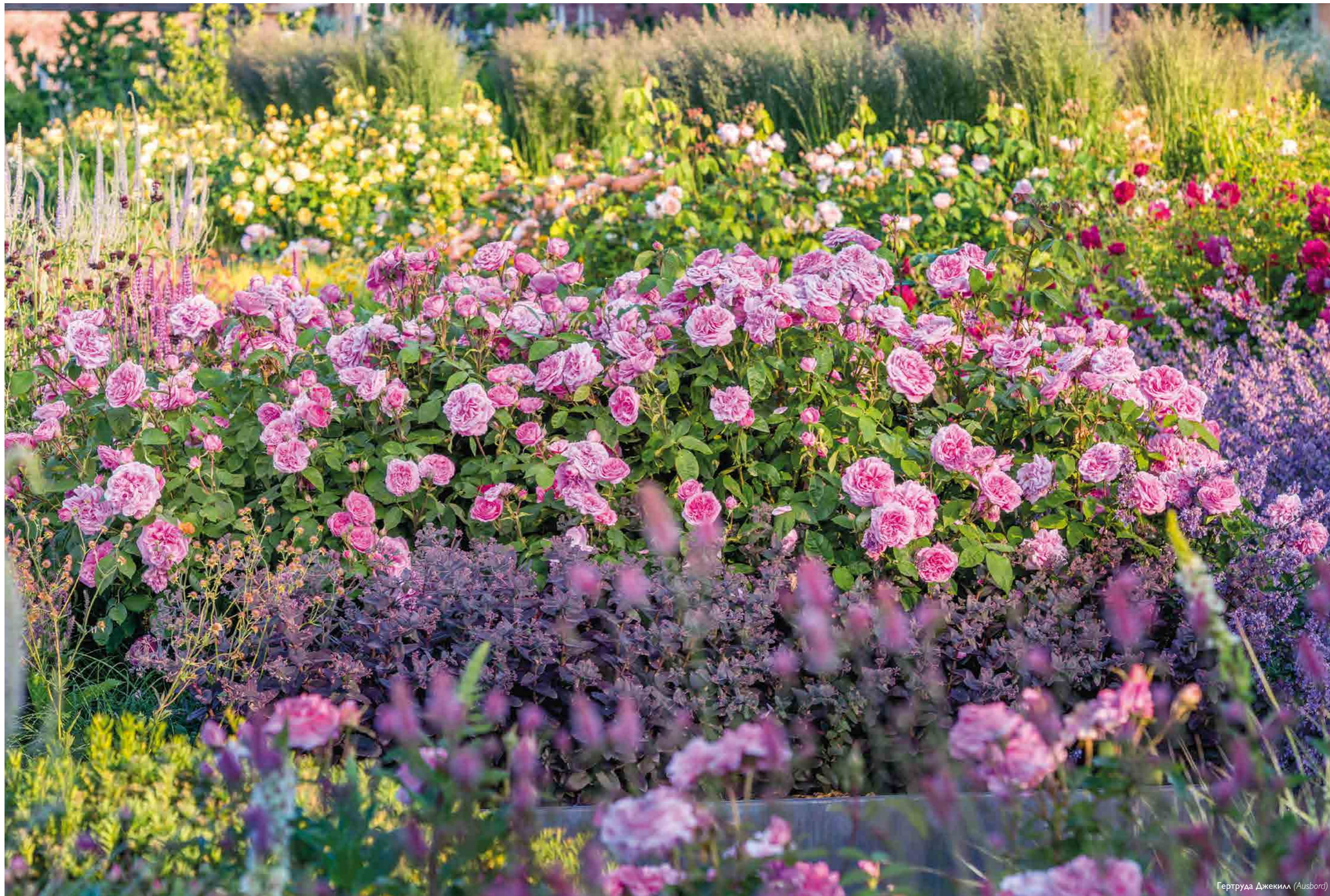
Гертруда Джекилл (Ausbord)