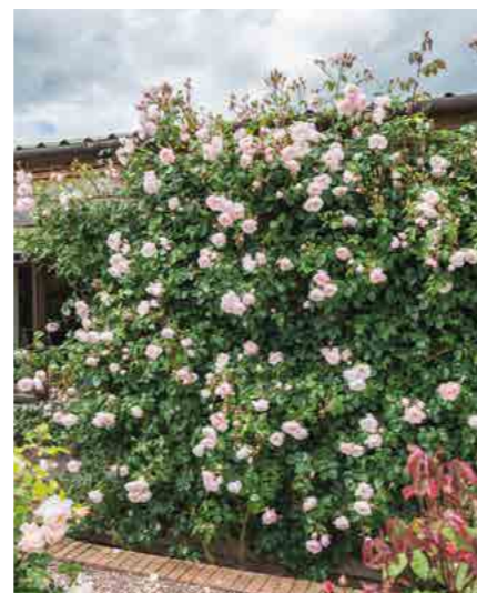
ЗЭ ДЖЕНЕРОС ГАРДЭНЕР THE GENEROUS GARDENER® (Ausdrawn) 4,5М