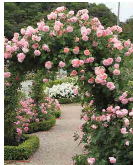
СТРОБЕРРИ ХИЛЛ STRAWBERRY HILL® (Ausrimini) 3М