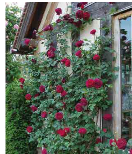
ФАЛЬСТАФ FALSTAFF® (Ausverse) 2,5М