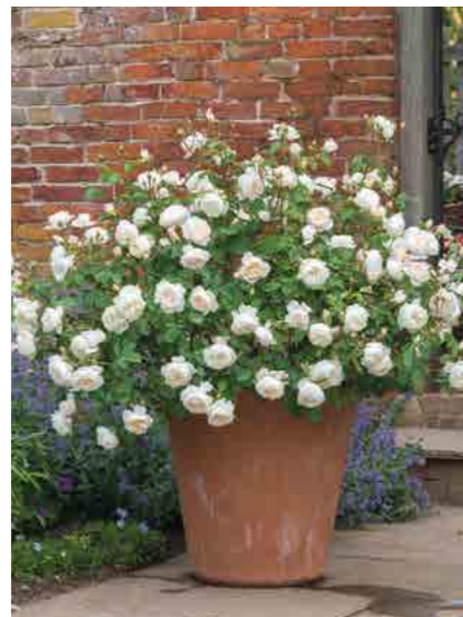
ДЕЗДЕМОНА DESDEMONA™ (Auskindling)