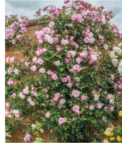
МОРТИМЕР САКЛЕР MORTIMER SACKLER® (Ausorts) 3,75М

Мы создали обширную коллекцию английских роз, которые можно выращивать как плетистые. Каскад изумительно красивых цветков, растущих по всей длине побега до самого основания, восхитительный аромат и отличная способность к повторному цветению — все это делает их одними из самых эффектных плетистых растений.