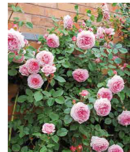
ДЖЕЙМС ГОЛВЭЙ JAMES GALWAY® (Auscrystal) 3,75М