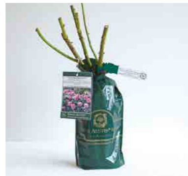
Роза с закрытой корневой системой (ЗКС)