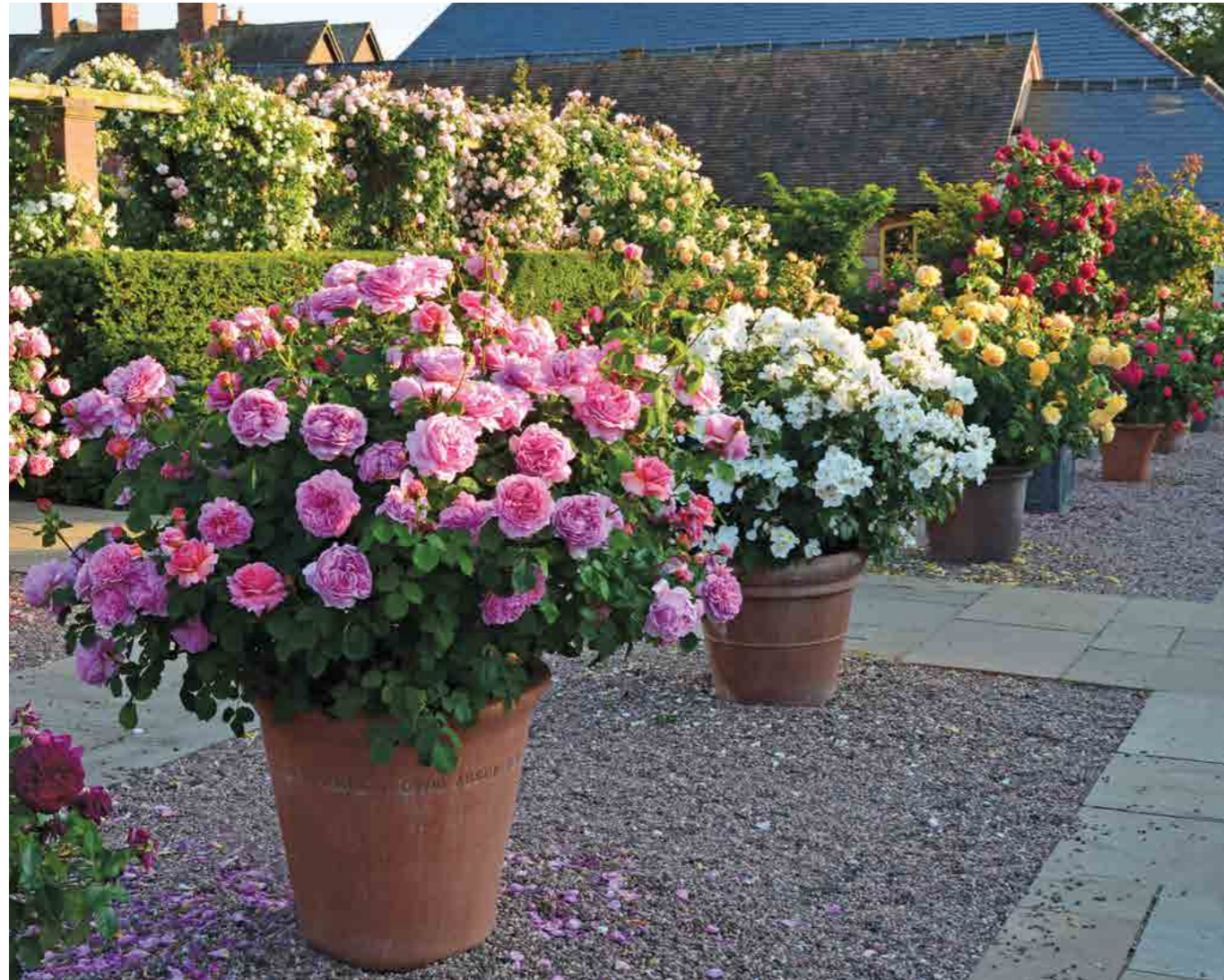
ПРИНЦЕСС АЛЕКСАНДРА ОВ КЕНТ PRINCESS ALEXANDRA OF KENT® (Ausmerchant), КЬЮ ГАРДЕНС KEW GARDENS® (Ausfence), ГОЛДЕН СЕЛЕБРЭЙШН GOLDEN CELEBRATION® (Ausgold), ТЭСС ОВ ЗЭ ДЭБЕРВИЛЗ TESS OF THE D'URBERVILLES® (Ausmove).

Один из наилучших способов насладиться ароматом роз Дэвида Остина в малом саду или даже на улице - если их выращивать в больших контейнерах. Множество наших роз прекрасно себя проявляют таким образом. Чем крупнее контейнер, тем лучше розы будут расти и процветать.