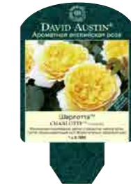
Этикетки для контейнерных роз 6л (12,5 x 10см)