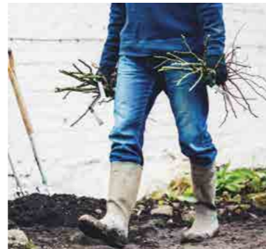
Розы с открытой корневой системой (ОКС)