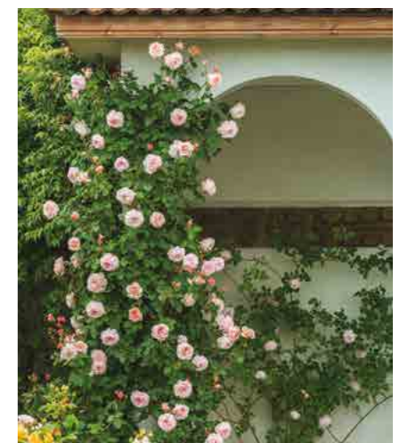
Э ШРОПШИР ЛЭД A SHROPSHIRE LAD® (Ausled) 3М