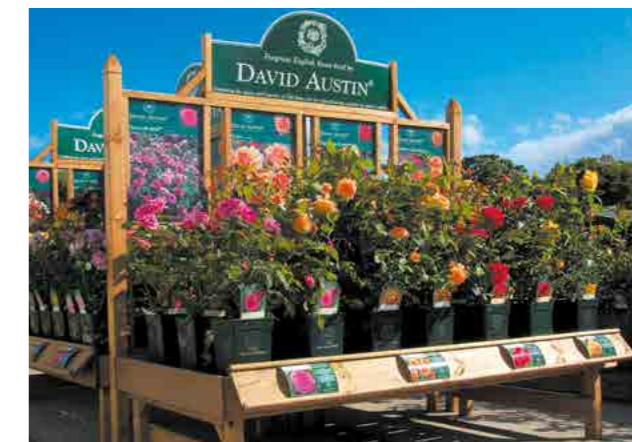
Скамья роз David Austin с верхней вывеской, плакатами и этикетками