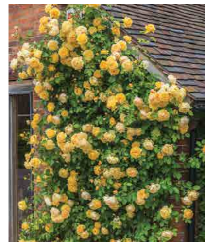
ГРЭХЭМ ТОМАС GRAHAM THOMAS® (Ausmas) 3,75М