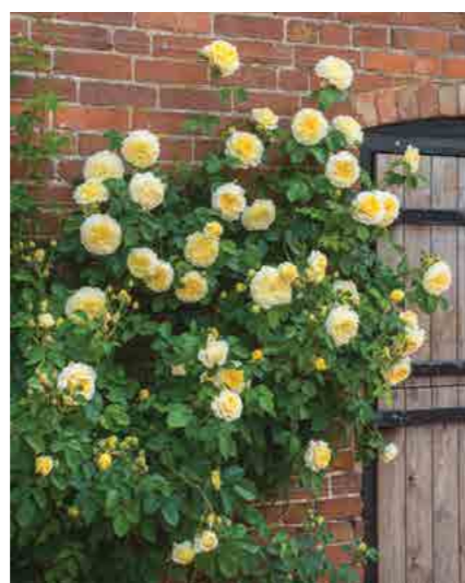
ЗЭ ПИЛГРИМ THE PILGRIM™ (Auswalker) 3,75М