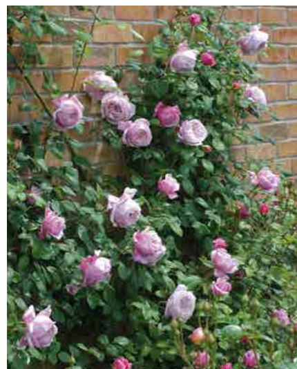
СПИРИТ ОВ ФРИДОМ SPIRIT OF FREEDOM® (Ausbite) 2,5М