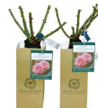
Золотые подарочные коробки доступны для заказа с розами ЗКС. Они транспортируются упакованы в плоском виде. Их просто и быстро собрать.