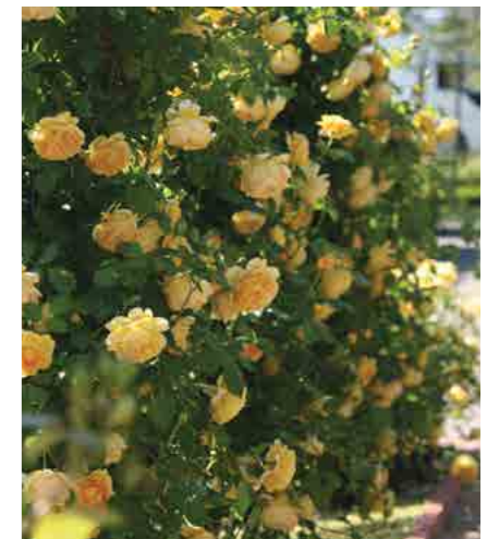
ГОЛДЕН СЕЛЕБРЭЙШН GOLDEN CELEBRATION® (Ausgold) 2,5М