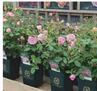
Контейнерные розы 6л