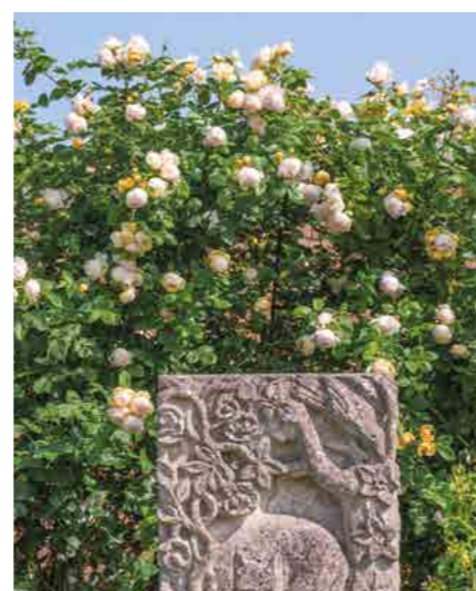
ВОЛЛЕРТОН ОЛД ХОЛЛ WOLLERTON OLD HALL® (Ausblanket) 3,75М