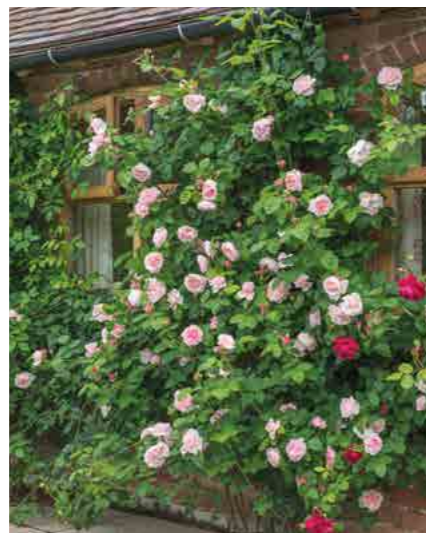
САНТ СВИЗАН ST. SWITHUN® (Auswith) 3М