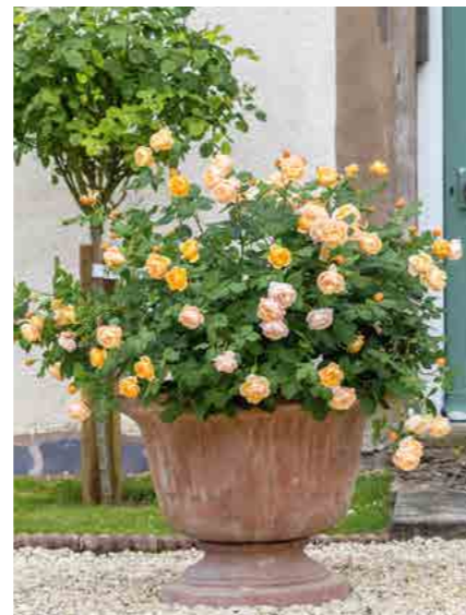
РОАЛЬД ДАЛЬ ROALD DAHL™ (Ausowlish)