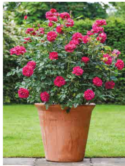
ДАРСИ БАССЕЛ DARCEY BUSSELL® (Ausdecorum)