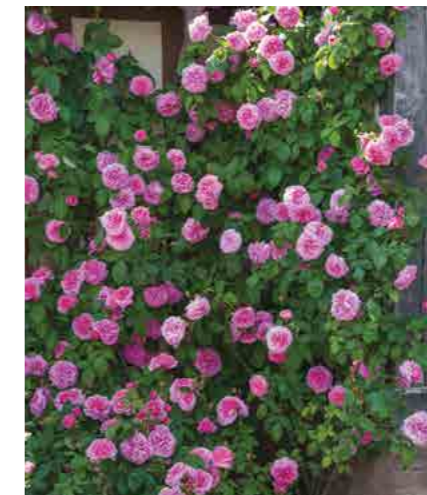
ГЕРТРУДА ДЖЕКИЛЛ GERTRUDE JEKYLL® (Ausboard) 2,5М