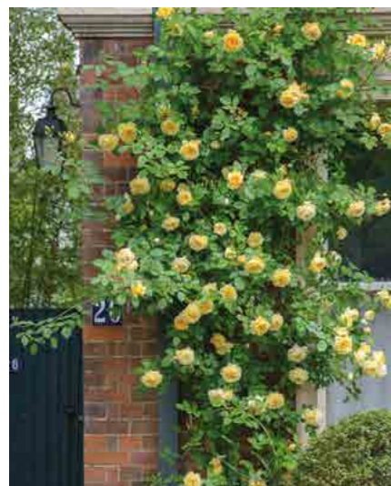
ТИЗИНГ ДЖОРДЖИА TEASING GEORGIA® (Ausbaker) 3,75М